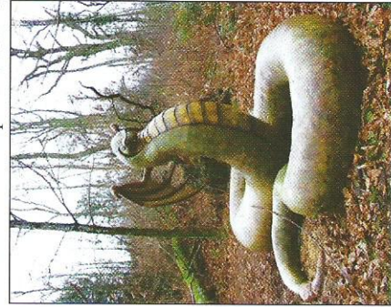
La Mandragore.