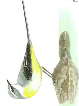
Bergeronnette des ruisseaux Dessin P. R.

Situation : Nantiat, à 30 km au Nord-Ouest de Limoges par la N147 et la D711