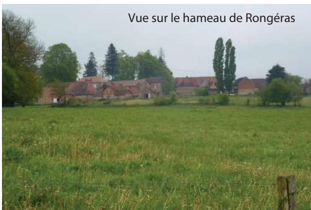
Vue sur le hameau de Rongéras

★ L'Isle prend sa source sur la commune de Janailhac, au sud du hameau de Rongéras à 375 m d'altitude. Son cours est estimé à 255 km dont 87 sont navigables (actuellement en plusieurs sections). Elle se jette dans la Dordogne à Libourne. (Source : Wikipédia)