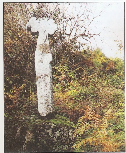
La croix du Marchand.

La croix du Marchand est située aux abords de la route départementale Le Buis - Roussac, près de l'intersection de la route de Saint-Symphorien-sur-Couze. Elle a donné un nom à ce lieu qui est appelé «La Croix du Buis». En 1612, un caravane de marchands, revenant de chercher des épices dans le sud de la France est attaquée par des voleurs. Le chef des marchands est tué lors de l'attaque et est enterré sur les lieux mêmes du crime. Sur la croix, qui surmonte la pierre tombale, on distingue une amphore, symbole des marchands. On distingue derrière la croix l'emplacement de l'ancienne route de Limoges empruntée par les voyageurs.